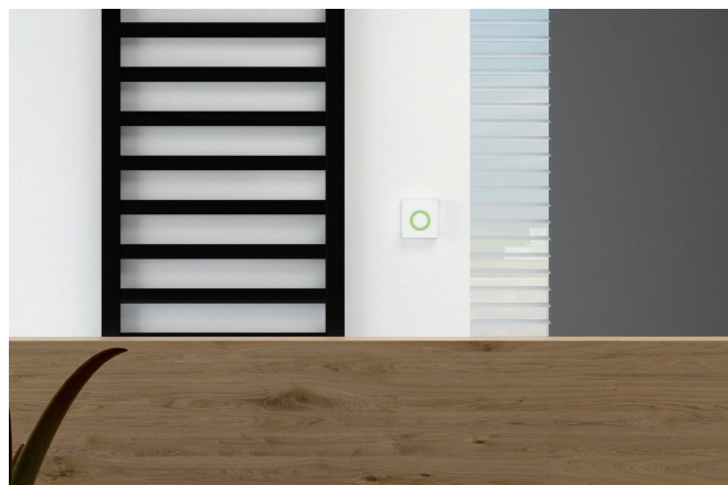
Schiebetüren lassen sich mit Zugangssystemen von BBC Bircher Smart Access komfortabel automatisieren.

Um seine magnetisch betriebenen Schiebetürbeschläge zusätzlich aufzuwerten, setzt das aufstrebende Unternehmen OPK Europe auf Sensorsysteme von BBC Bircher Smart Access. Kunden können für beide Seiten der Tür wählen zwischen dem Überkopf-Bewegungssensor PrimeMotion B und dem berührungslosen Schalter CleanSwitch, um ihre Schiebetüren zeitgemäss und komfortabel zu öffnen.