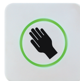
Beispiele für kundenindividuelle Gestaltungsmöglichkeiten des CleanSwitch