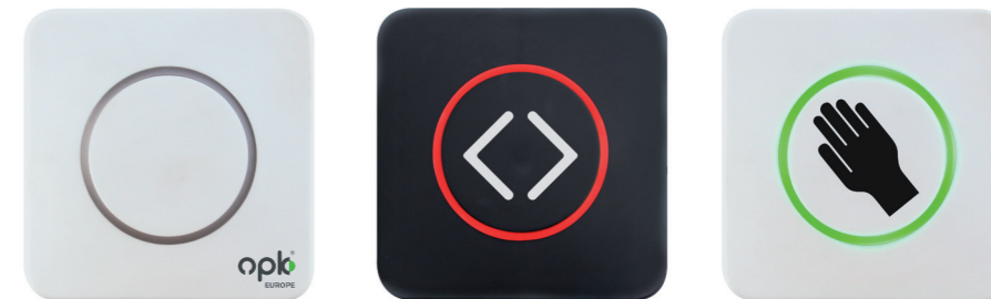
Exempel på kundspecifika designalternativ för CleanSwitch

"Vi har lång erfarenhet på marknaden och kände redan till Bircher. När vi såg CleanSwitch och PrimeMotion tänkte vi omedelbart: där har vi dem, de passar perfekt till våra produkter! När de beställda produkterna sedan direkt och utan problem fungerade i våra test, tvekade vi inte länge utan inkluderade dem i vårt produktsortiment."